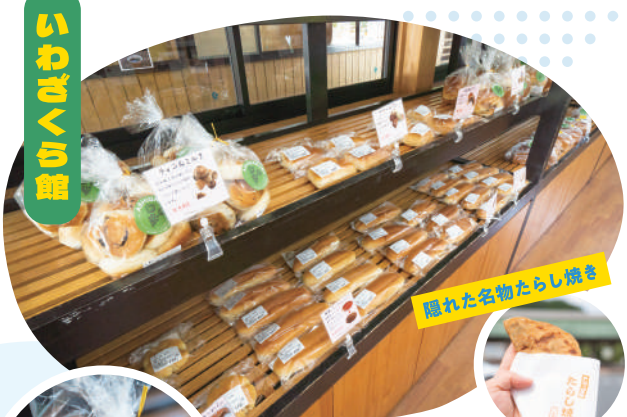
福れた名物たらし焼き