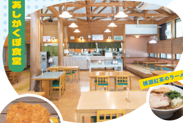
横瀬紅茶のラーメン