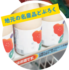
地元の名産品とぶろく

地元農家の新鮮でリーズナブルな商品を多数取り扱っています。地元の農家さんが丁寧に育てた野菜・果物の味は格別です！季節に応じて変わるラインナップをぜひお楽しみください。